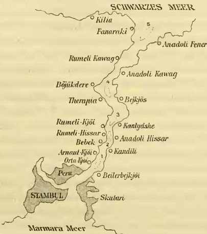
1-5 Kolke im Bosphorus

Noch deutlicher als dies durch die Berghaus'sche Darstellung der Kolke auf dem Grunde des Bosphorus (vergl. die darnach hergestellte Figur 1) ersichtlich gemacht wird, erweist die Erörterung der Tiefenverhältnisse des Bosphorus durch